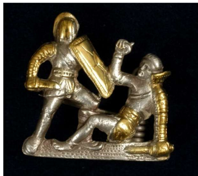
Aranyozott ezüst fibula gladiátorábrázolással az Aquincumi Múzeum gyűjteményéből

Természetesen nem csak kardból állt a felszerelésük. Fegyverzetük és páncéljaik alapján a gladiátorok különböző fegyvernemekre oszthatók és ennek okán alapvetően párban küzdöttek. A legismertebb, legközkedveltebb párosítások például a secutor-retiarius és thraex-murmillo voltak. A párosítások kialakításánál törekedtek a felszerelés és testi erőbeli kiegyensúlyozottságra. A gladiátoroknak alapvetően két nagy csoportját lehet megkülönböztetni. A rabszolga, hadifogoly és bűnöző származásúak, akik társadalmi helyzetük és létszámuknál fogva élethalál küzdelmet vívtak a nép szórakoztatása végett. A mennyiségi küzdőkkel szemben a minőségi harcot a polgári származású, önkéntes gladiátorok mutatták be, akik megfelelő ellátásban és képzésben is részesültek. Őket egy adott élethelyzet vagy akár a kalandvágy motiválta. Az ő esetükben elsősorban a harc színvonala (izgalma, profizmusa, drámaisága) szórakoztatta a népet. Az egykoron híres gladiátorokat a legkülönbözőbb hétköznapi tárgyakon jelenítették, örökítették meg. Aquincumban is számos gladiátorábrázolással találkozhatunk kerámia, üveg, ezüst, csont tárgyakon egyaránt.