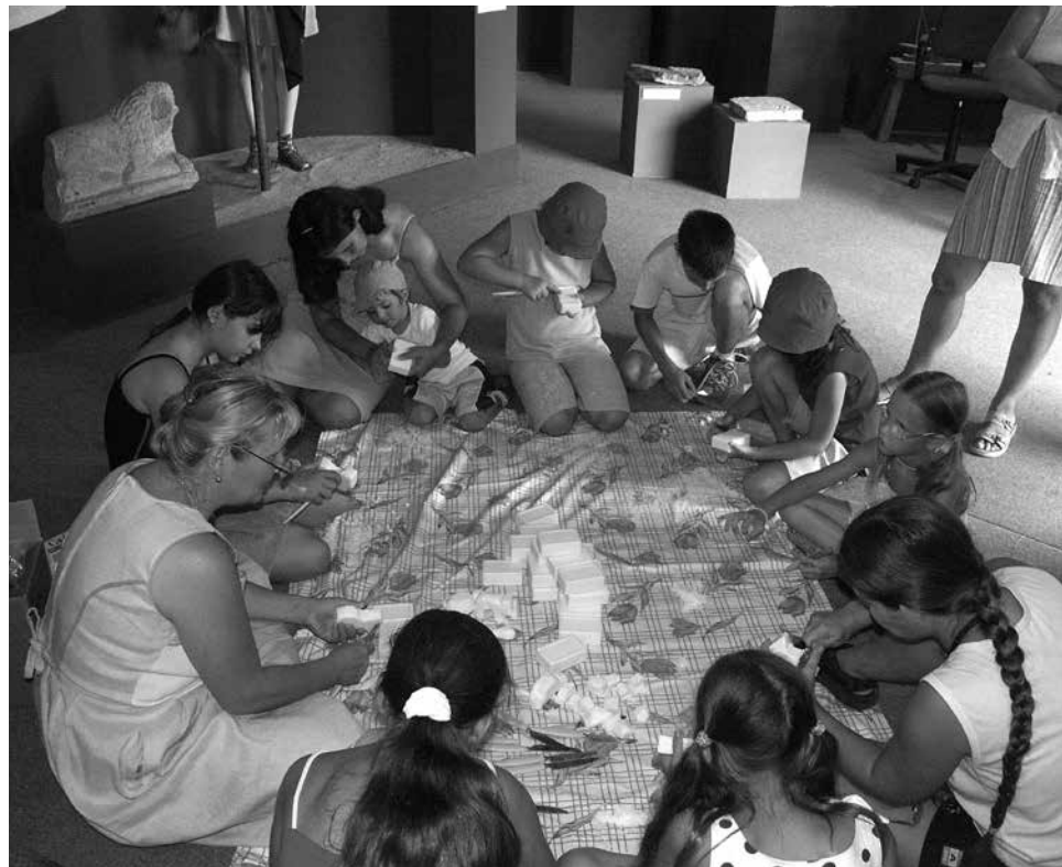
Állatfigura készítése szappanfaragással az „Állatok az emberek világában” c. kiállításon