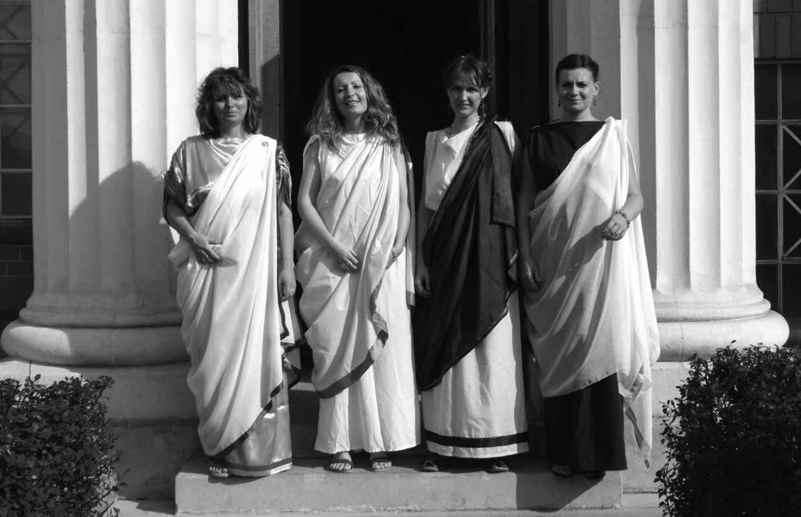
A múzeum közművelődési munkatársai, az Aquincumi Ünnepi Játékok szervezői