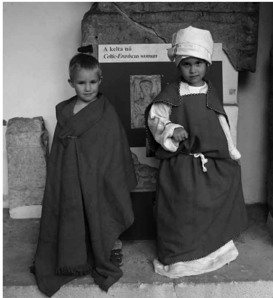
Kelta viseletbe öltözött gyerekek Jupiter napján Aquincumban