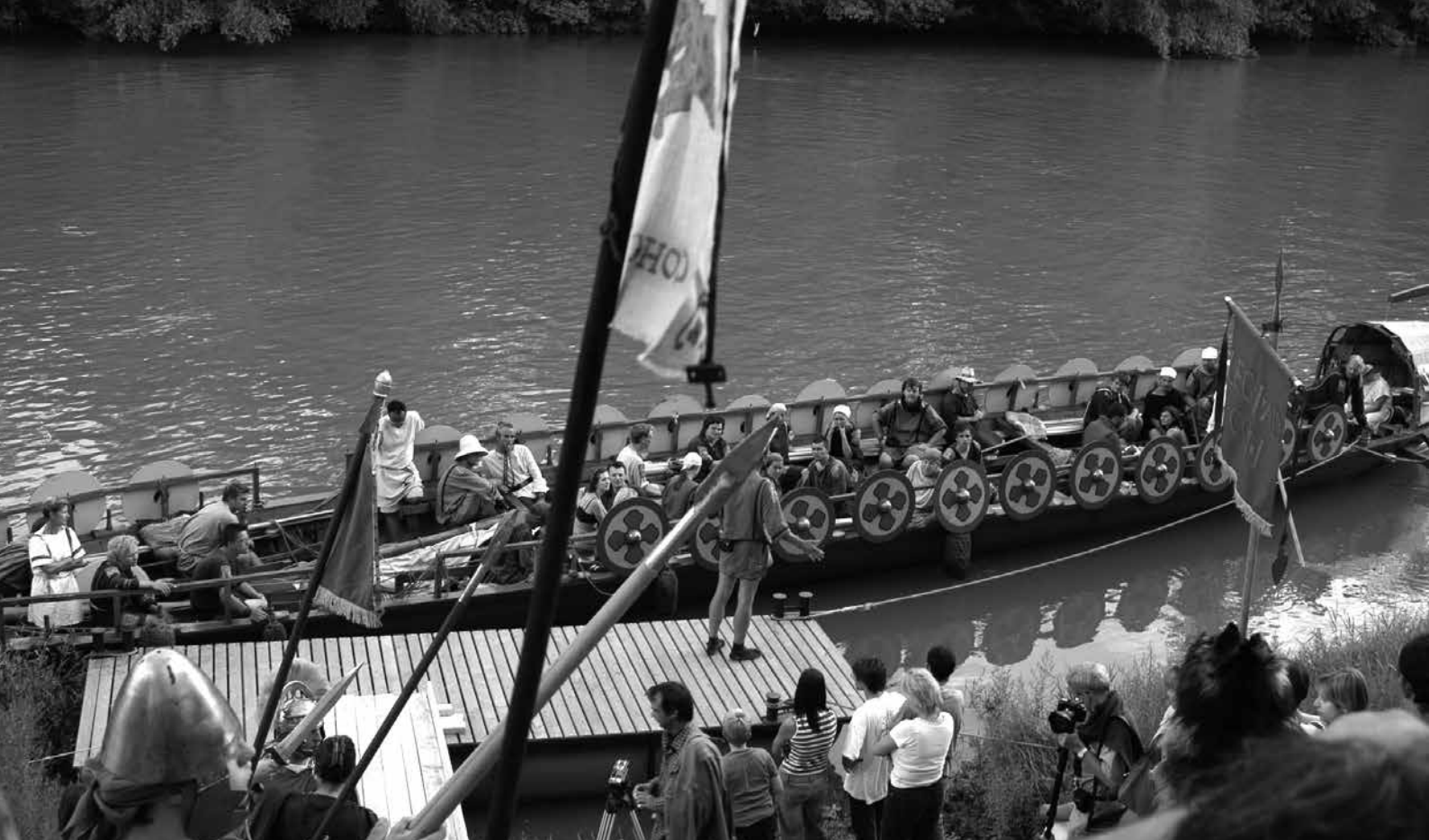
A Regensburgi Egyetem gályája kiköt az aquincumi Duna-parton

tatások által feltételezett egykori kikötői zónában kerültek megrendezésre.