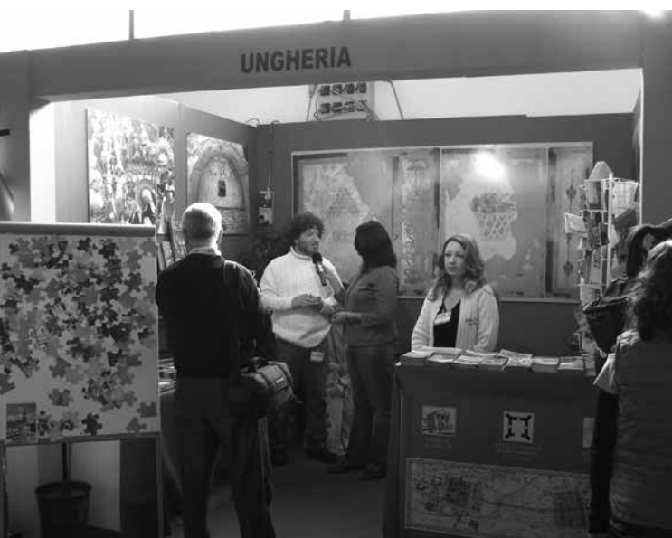
Az Aquincumi Múzeum és a KÖH közös standja

2006 novemberében immár kilencedik alkalommal került megrendezésre Olaszországban, Paestumban, a Borsa Mediterranea del Turismo Archeologico (Mediterrán Régészeti Turisztikai Találkozó), melyen az Aquincumi Múzeum negyedik éve képviselteti magát. Az elmúlt esztendőben, Salerno város polgármesterének meghívására, az Aquincumi Múzeum és a Kulturális Örökségvédelmi Hivatal (KÖH) szakemberei vettek részt nagy sikerrel a börzén.