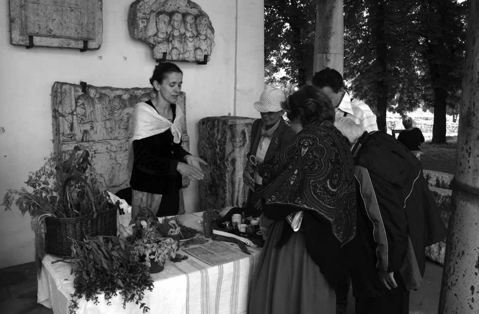
Gyógyfüvek, gyógynövények vására Aesculapius ünnepén

cumi leletanyag felhasználásával állítottak össze a múzeum munkatársai.