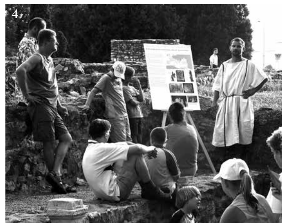
Részletek a Pompa Romana eseményeiből: 1. A felvonulás részlete a Pacsirtamező utcában 2. A felvonulók bemutatkozása a Nagyszombat utcai amfiteátrumban 3. Mozaikkészítés a déli táborkapunál 4. Régészek előadásai a romterületen

el, rögtönzött koncertek, a Római Fürdő klasszicizáló bejáratánál pedig áldozatot mutattunk be az isteneknek. Az első nap csúcspontja azonban a polgárvárosi amfiteátrumban tartott gladiátor bemutató volt. Innen az addigra már több száz főre nőtt nézősereg az Aquincumi Múzeumba sietett, ahol kézműves foglalkozásokon vettek részt. Nemcsak a korabeli mesterségekkel ismerkedhettek, hanem aki akart, ízelítőt kaphatott a római kori gasztronómia ínycségeiből is.