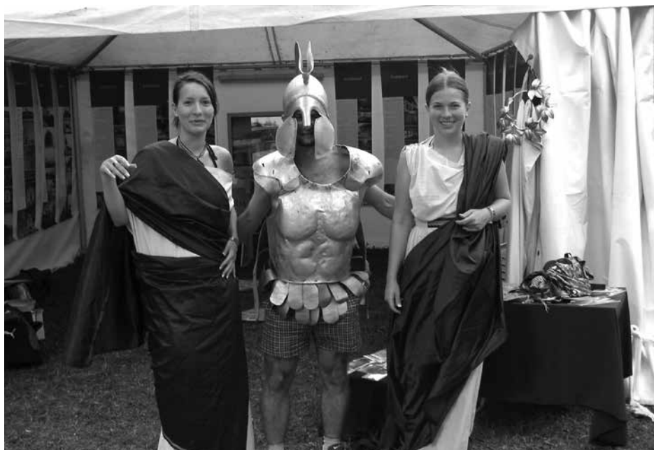
Ókori ruhába öltöztetett szigetlakók az Aquincumi Múzeum és a KÖH közös sátra előtt

rendezvényen a Civil Szigeten állítottuk fel a KÖH-hel közös sátrunkat. A Kulturális Örökségvédelmi Hivatal képviselői memóriajátékkal, kvízzel és filmvetítéssel várták a kulturális értékeink és műemlékeink iránt érdeklődőket. Az Aquincumi Múzeum munkatársai minden nap más jellegű kézműves programmal és régészeti előadásokkal készültek. A sátorba betérők szívesen készítettek maguknak római stílusú ékszereket, színes mozaikképeket, s a legelszántabbak a restaurátorok munkájába is bepillantottak: az apróra összetört kerámiák összergasztását is kipróbálhatták.