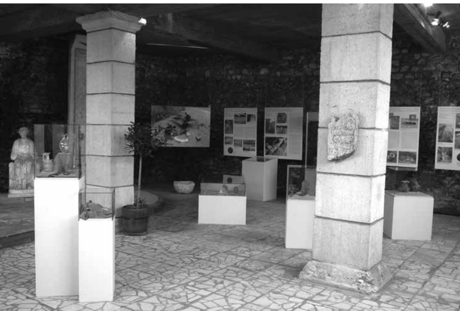
A kiállítás részlete az aquincumi romterület Kétpilléres védőépületében

Az előző évek hagyományait folytatva, tizedik alkalommal rendeztük meg kiállításunkat az előző év során előkerült régészeti leletekből válogatva. Mint minden évben, most is nehéz döntésre kényszerültünk: a múzeum átmeneti raktárába került tárgyak közül kellett választani és kiállítható állapotba hozni az előző év „termését” reprezentáló darabokat.