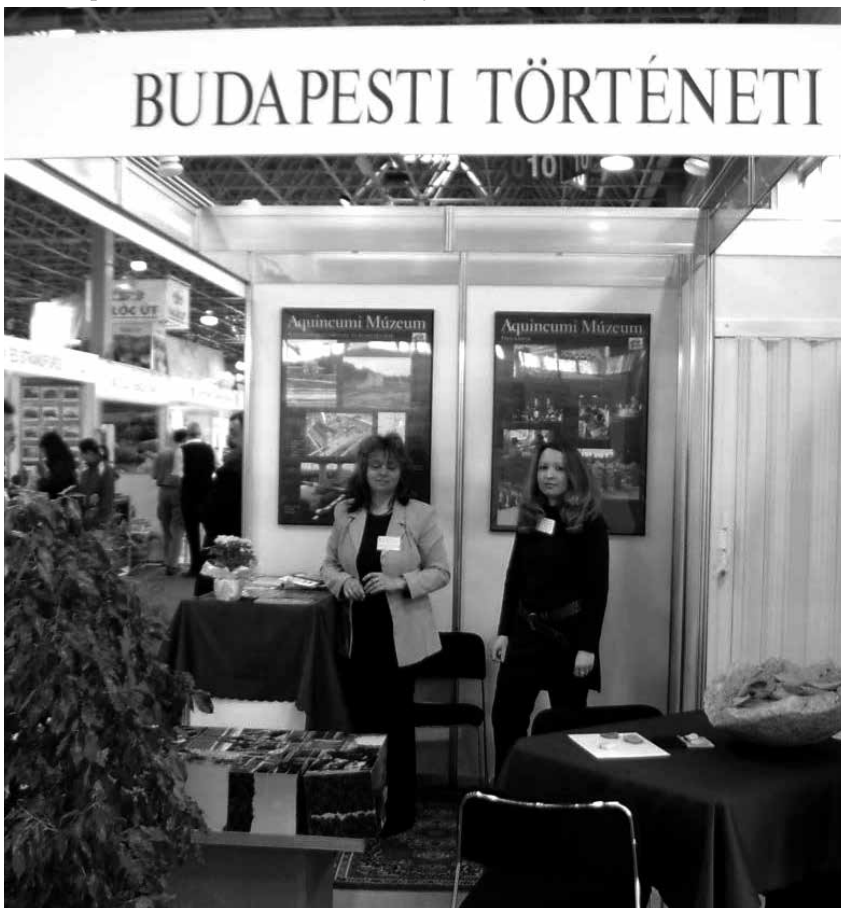
A Budapesti Történeti Múzeum standja a kiállításon