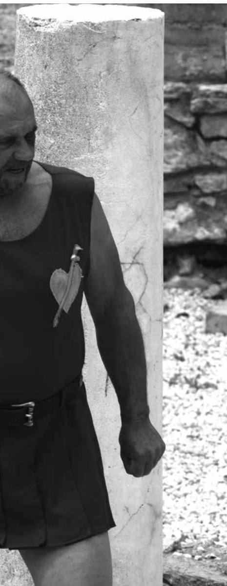
– képek és hangulatok Gorsiumból” című