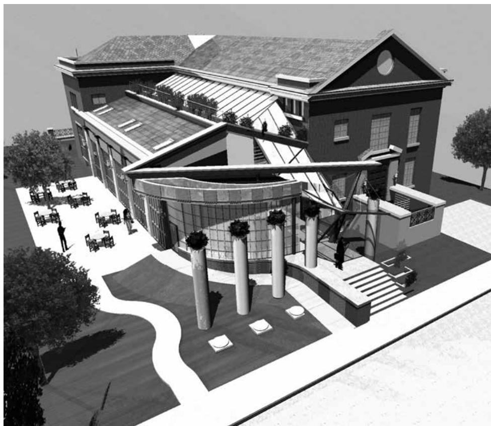
A volt ELMŰ épület átalakításának látványterve