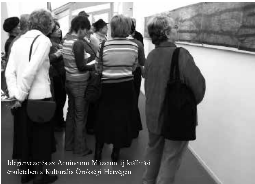
Idegenvezetés az Aquincumi Múzeum új kiállítási épületében a Kulturális Örökségi Hétfévégen