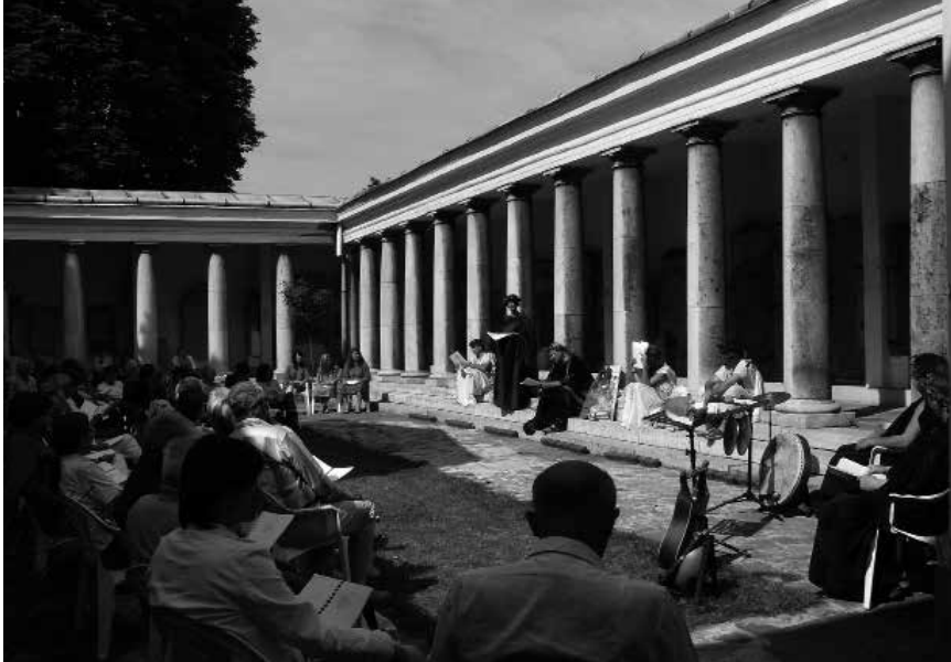
Részlet a X. Aquincumi Költőversenyből 2007. június 1-jén a múzeum kőtarában