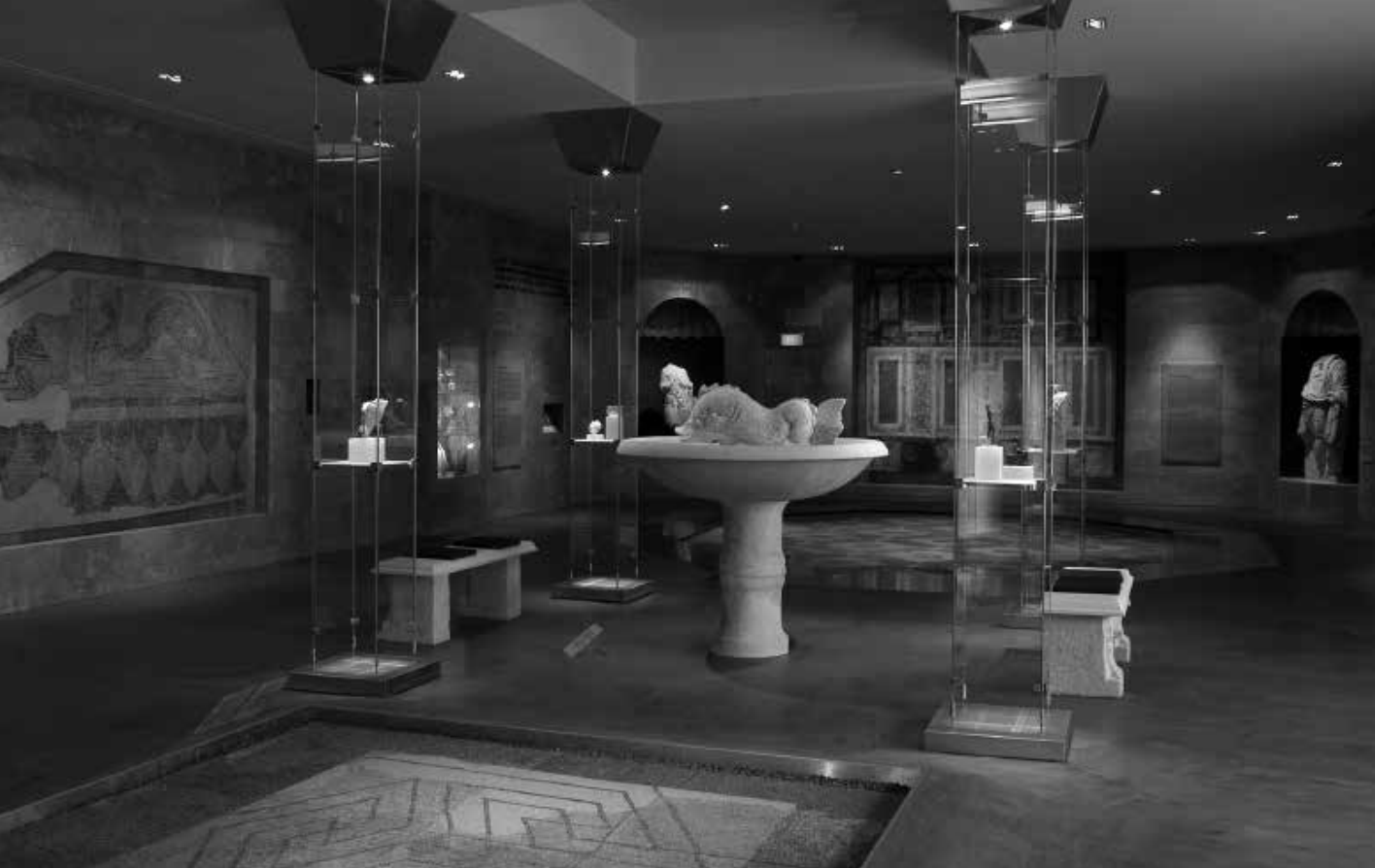
A „Róma Aquincumiban” című kiállítás részlete az Aquincumi Múzeum új kiállítási épületében

reprezentatív belső térélménnyel szolgáló nagyterembe, mely a helytartói palota emlékeit tárja elénk. A terem belső kialakítása a római kort idézi. A falakon falfestmények, mozaikok, a falak mentén a múzeum legszebb és legmonumentálisabb szobrai láthatók, melyek a császárt, a helytartót, és a római Pantheon kedvelt isteneit ábrázolják. A padlót minden eddigénél nagyobb kiterjedésben borítják helyreállított aquincumi mozaikok. Közülük néhányat most először tekinthetnek meg a látogatók. A múzeum kis alapterületű kiállítótermei eddig nem adtak lehetőséget ilyen méretű műtárgyak bemutatására. A hajógyári mozaik sorsa jól mutatja, hogy a megmentett régészeti emlékek tárolva és megőrizve új értékek létrehozásának kiindulópontjai lehetnek. A múzeumok régészeti raktárai pedig az új értékek teremtésének tárházai. A vitrinekben bemutatott tárgyak Róma Aquincumba is eljutó luxusának bizonyítékait tárják elénk. Az arany-, és ezüstékszerek, üveg-, bronz- és