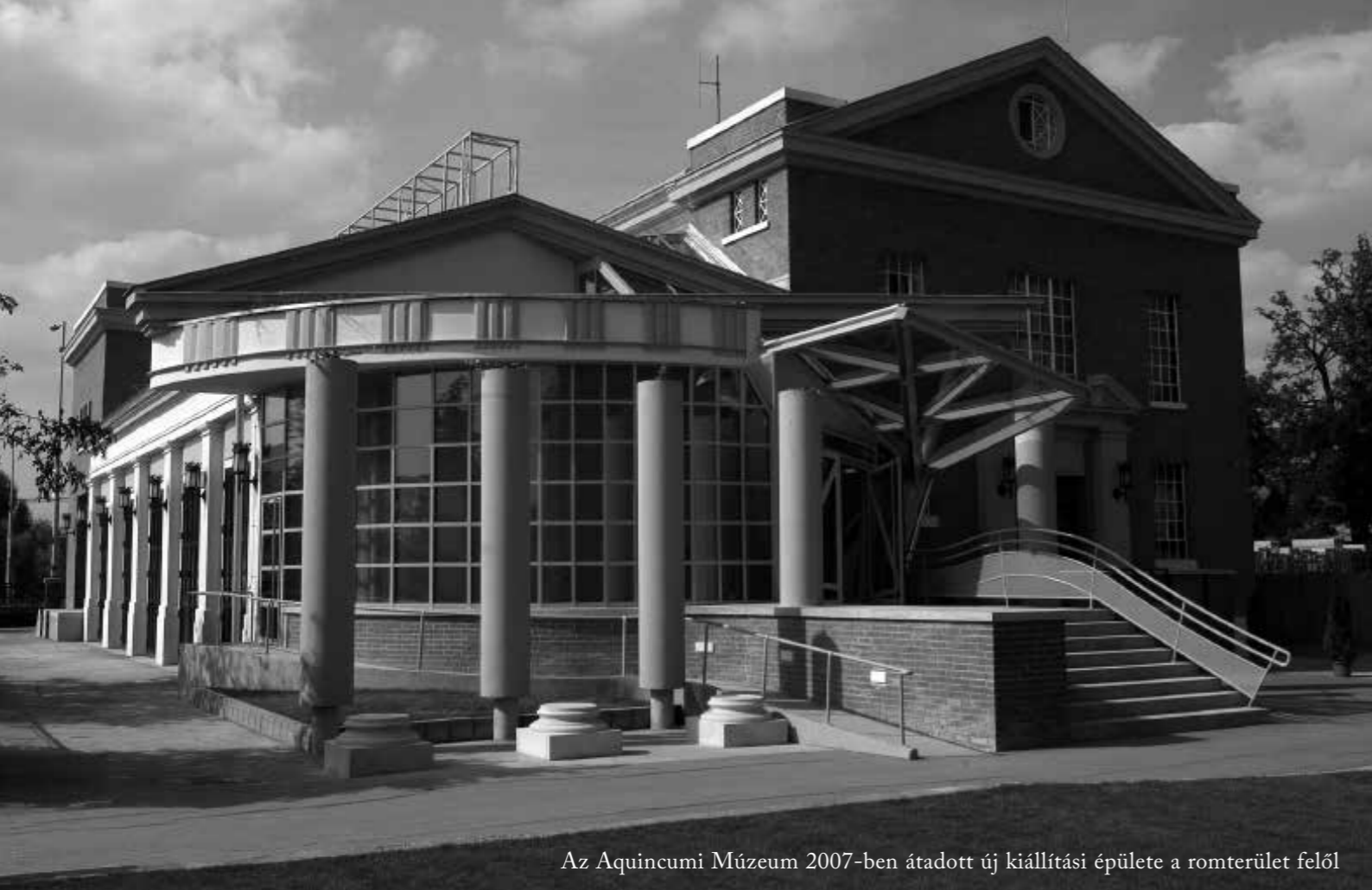
Az Aquincumi Múzeum 2007-ben átadott új kiállítási épülete a romterület felől