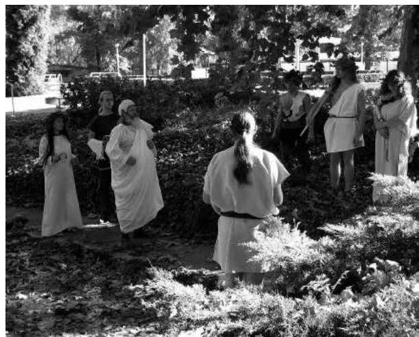
Áldozatbemutató a Római Strand egyik forrásánál

A múzeum a rendezvényt egyre bővülő programelemekkel kívánja integrálni az aquincumi hagyományörző programok sorába.