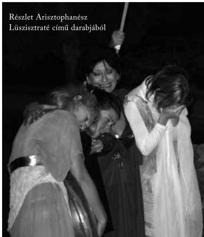
Részlet Arisztophanész Lüsizisztraté című darabjából