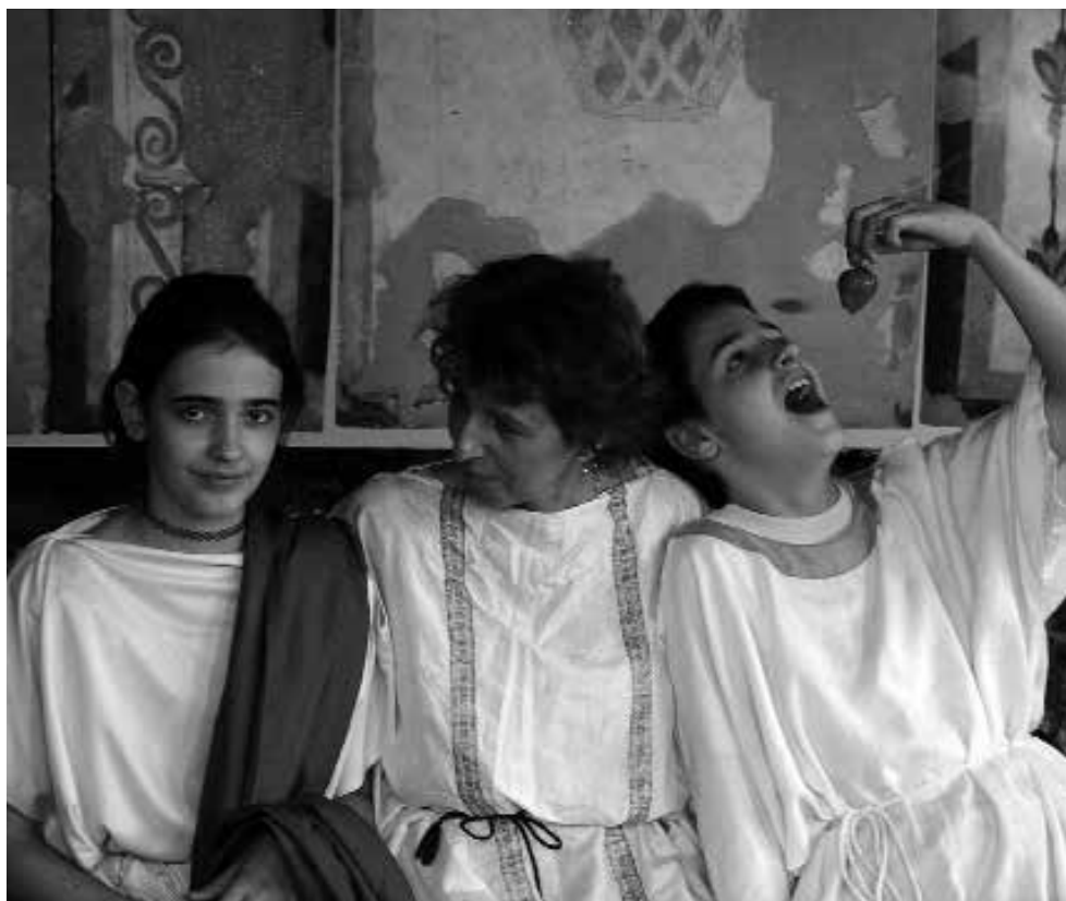
Római ruhába öltöztetett látogatók a romterület „kétpilléres” termében a Floralia rendezvényen