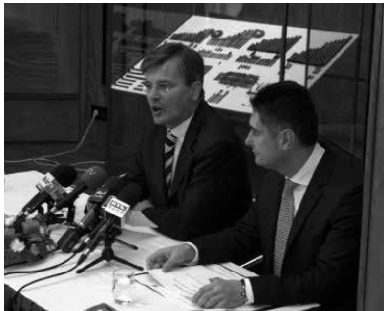
Budapest Főváros Önkormányzatának sajtótájékoztatója (Demszky Gábor főpolgármester és Horváth Csaba főpolgármester-helyettes) Budapest 2007. évi kulturális fejlesztéseiről