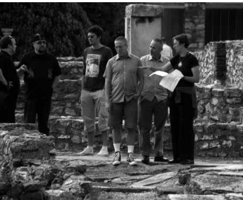
Steven Saylor amerikai író Budapestre látogatott Róma című könyvének magyarországi, könyvheti megjelenésére. 2007. május 30-án felkereste az Aquincumi Múzeumot