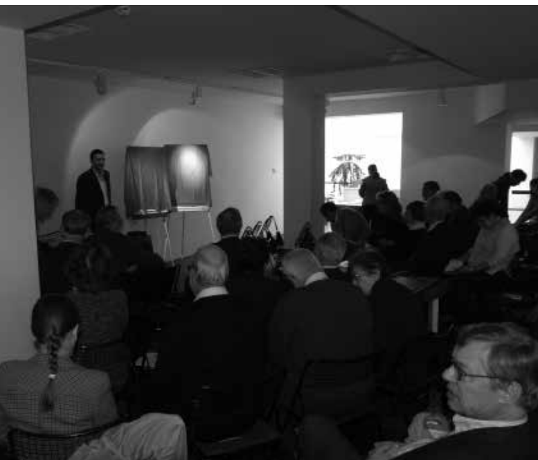
Az ICOMOS Magyar Nemzeti Bizottságának XVII. Közgyűlése az Aquincumi Múzeum új kiállítási épületében