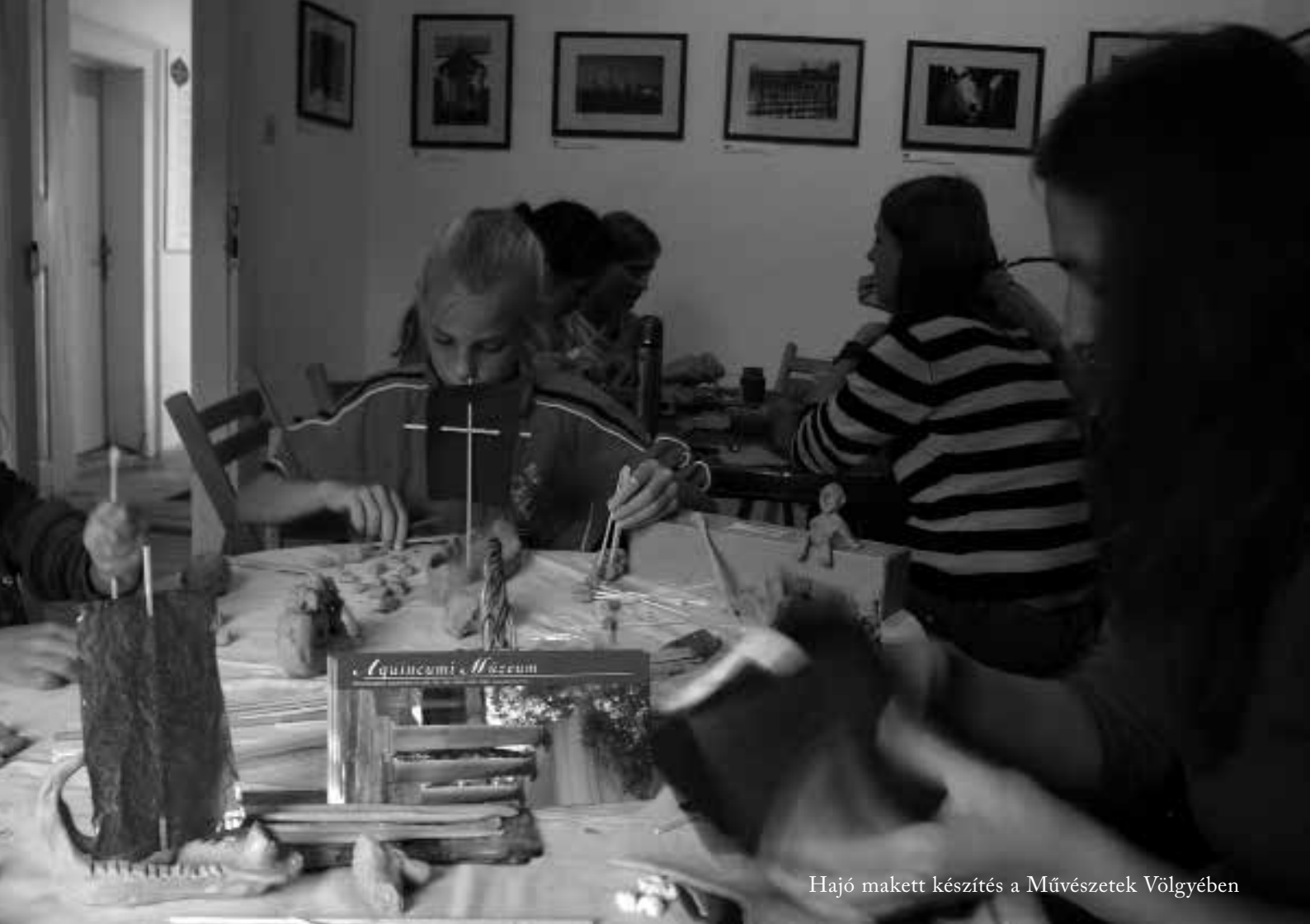
Hajó makett készítés a Művészetek Völgyében