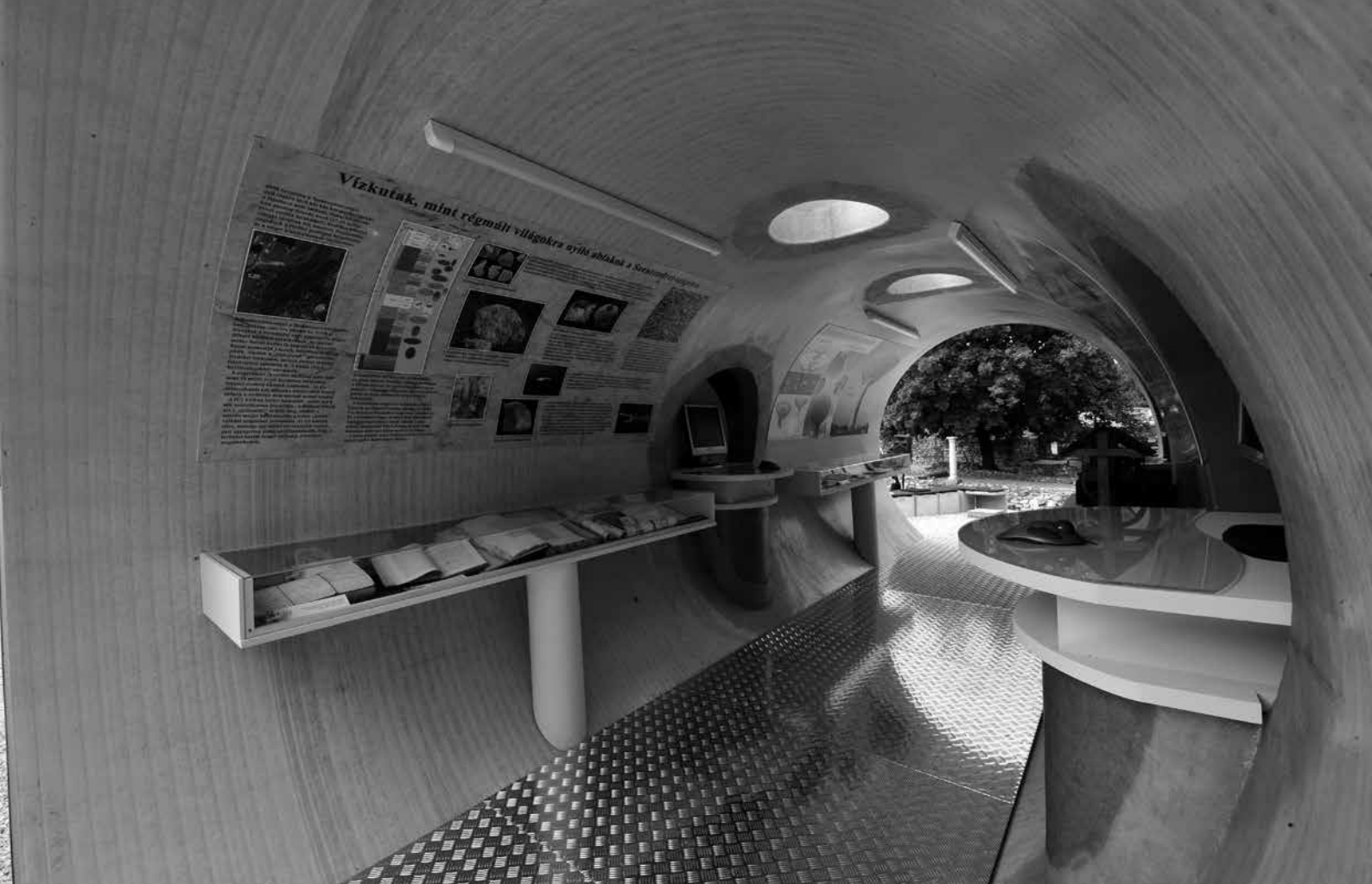
Részlet a „140 éve a főváros szolgálatában” című kiállításból

vzellátását teljes mértékben automatizálták. Ez mennyiségi, minőségi és biztonsági szempontból is megnyugtatóan alkalmas egy ilyen méretű világváros ellátásához.