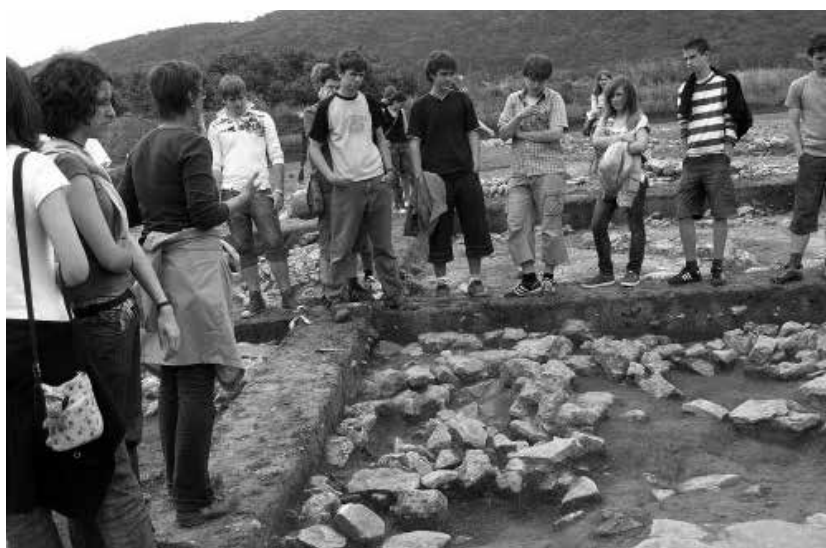
Diákcsoportot a Csúcshegy-Harsánylejtőn folytatott ásatáson

Végül, de nem utolsósorban említenünk kell az ásatási nyílt napokat, amelyek az éppen futó, beruházásokhoz kapcsolódó régészeti kutatásokba engednek betekintést.