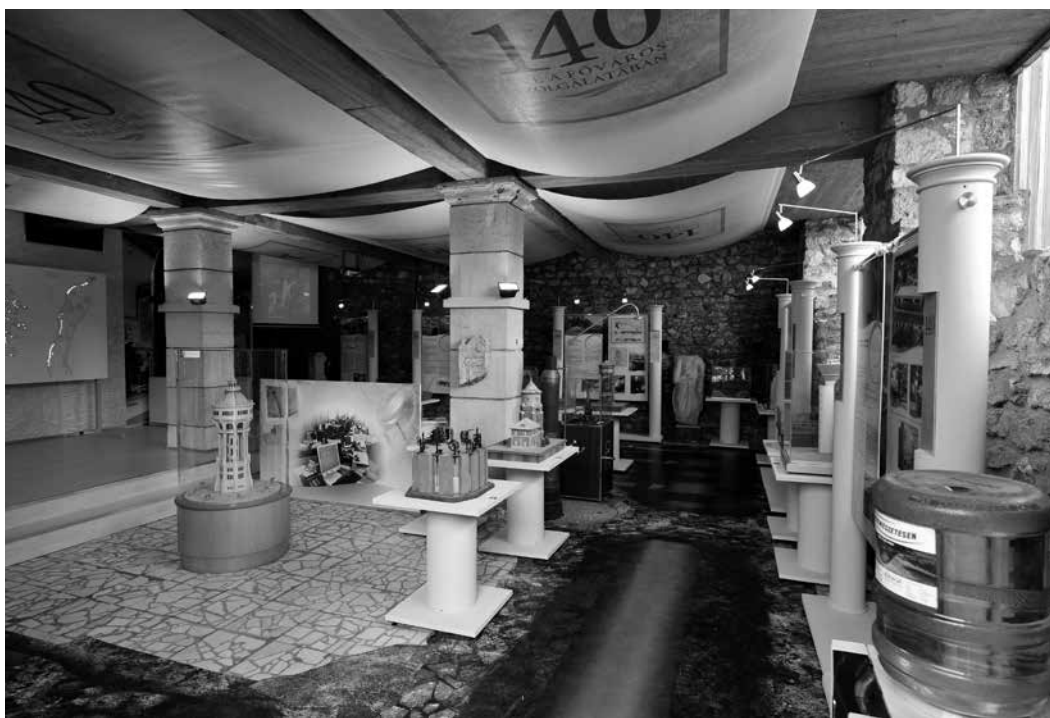
Részlet a „140 éve a főváros szolgálatában” című kiállításból

Az utolsó néhány év az elektronika előretörését hozta. Napjainkban a termelő-berendezések szabályozását frekvenciaváltók végzik, a gépházakat komputervezérléssel irányítják, felügyelik. Megoldott a köztéri munkák folyamatirányítása is, amelyet a központi diszpécser szolgálat tart kézben. Ma már elmondható, hogy a főváros