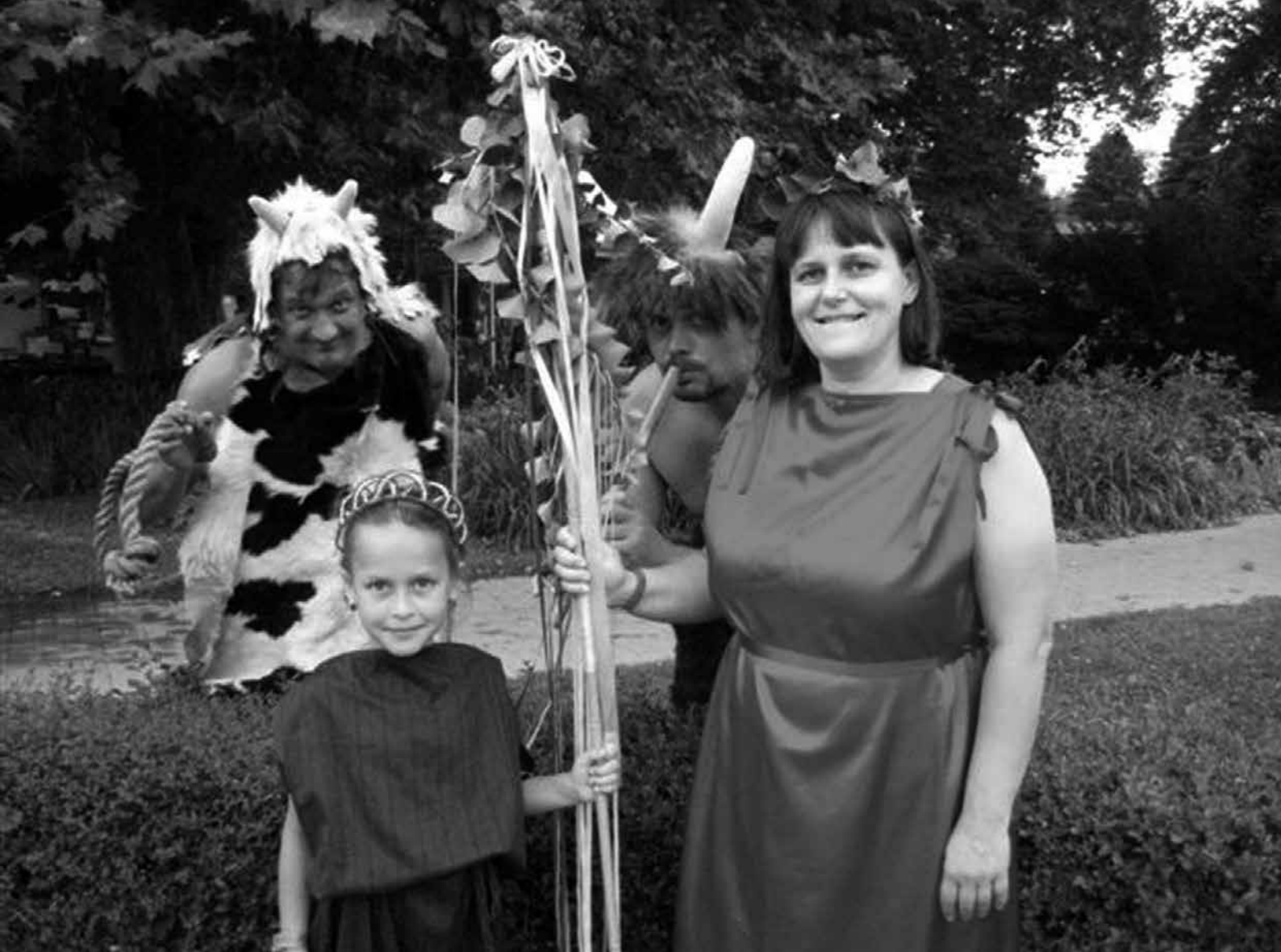
Látogatók a Nimfa ünnep „Öltözz nimfának!” programján

előadás megrendezésére. Ez azonban Óbuda-Békásmegyer Önkormányzata támogatása nélkül nem valósulhatott volna meg.