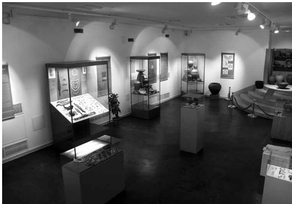
Részlet „A kelták Budapest régészeti emlékeiben” című kiállításból