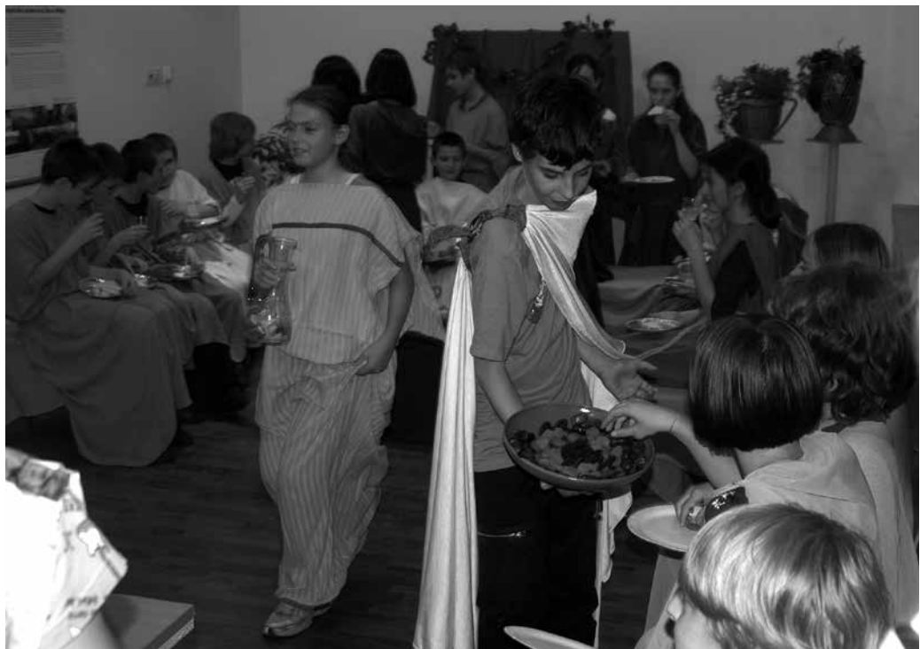
A „Légy vendég a helytartó udvarában!” című foglalkozás lakomarészlete