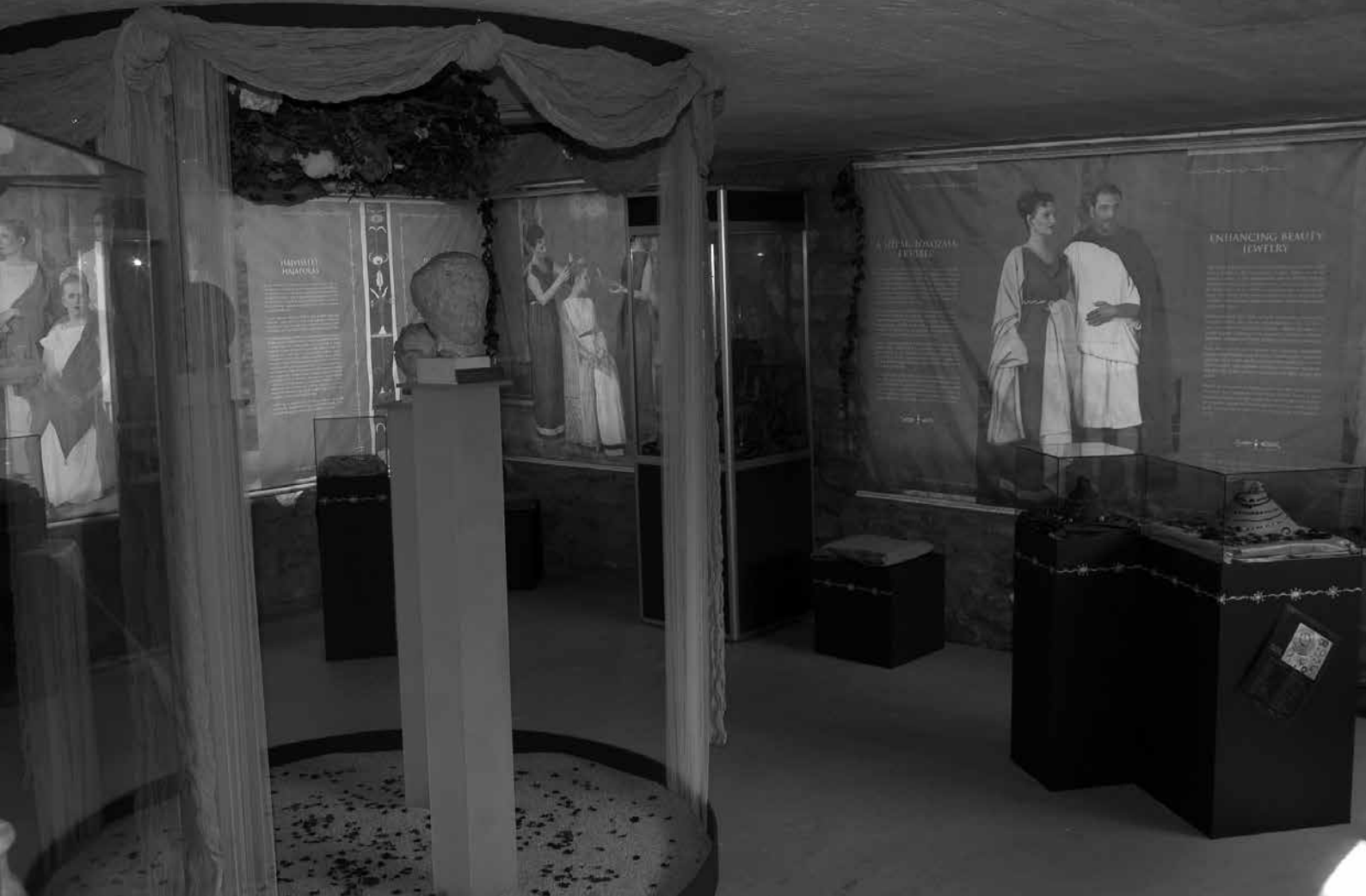
A „Venus és Hygieia birodalma” című kiállítás részlete

illatszeres üvegek sokasága idézte fel. A szépségápolás témaköre nem lenne teljes a szépség fokozására szolgáló ékszerek bemutatása nélkül. Két vitrinben az aquincumi ékszerekből készült válogatást - ezüst-, bronz karpereceket, gagát gyűrűket, üvegpasztá gyöngysorokat, valamint arany fülbevalókat, nyakláncokat, gyűrűket – csodálhattak meg a látogatók.