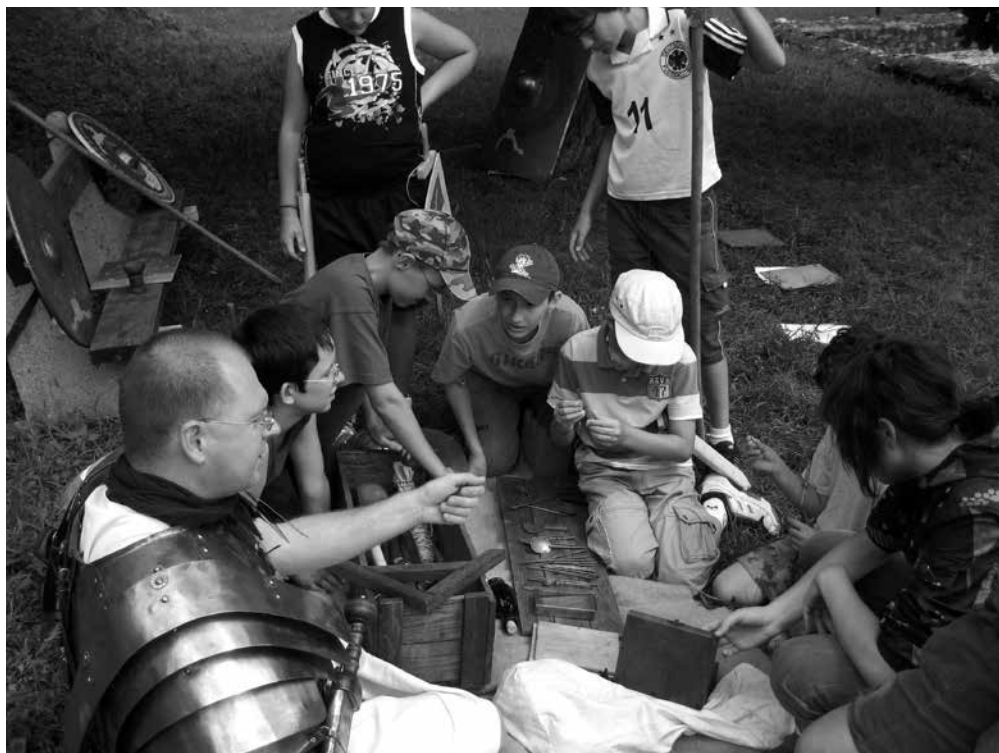
Bemutató a katonai tábor életéből az aquincumi nyári táborban

A tapasztalatokról pedig annyit, hogy amikor meghirdettük a tábort nem számítottunk ekkora érdek-