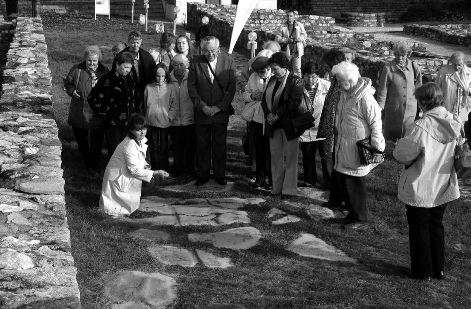
A Múzeumok és Látogatók Alapítvány által szervezett nyugdíjasoknak szóló program résztvevői az aquincumi romterületen

hívjuk meg a résztvevőket, hanem a személyes tapasztalataik megosztására, illetve konkrét kérdések megfogalmazására is alkalmat adunk. A foglalkozások során olyan tevékenységekben, feladatmegoldásokban, játékokban is részt kell venniük a jelentkezőknek, melyek rejtett vagy fel nem ismert tudásokra, tapasztalatokra és készségekre irányítják rá a figyelmüket. Az elmúlt időszak tapasztalatai alapján a műhelyek nagyon hasznosnak és gondolatébresztőnek bizonyultak. Az interaktív, gyakorlati munka a más körülmények közül érkező emberekkel megosztva, inspirálóban hat, mint az egyszerű előadás. Esetenként a már elvetésre ítélt gondolatokat, ötleteket felélesztheti, illetve átformálhatja.