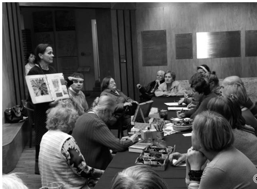
Ismerkedés az ókor növényeivel „A természetből nyerhető, színek, illatok és ízek kincsháza – avagy látogatás egy római kertben” című AnticCafén