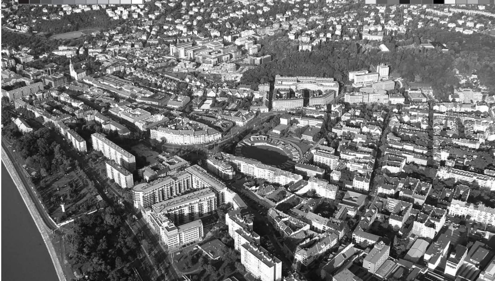
Óbuda látképe a katonavárosi amfiteátrummal