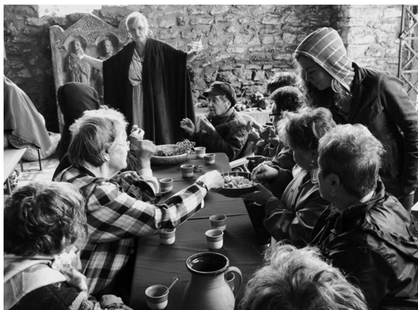
Előadás és kóstolás a „Római tál – Ókori fortélyok” című AnticCafé keretében