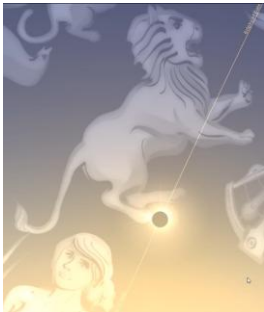
Napfogyatkozás az Oroszlán csillagképben

9, Mit nem találtak meg a Symphorus mithraeum és környékének ásatásán?